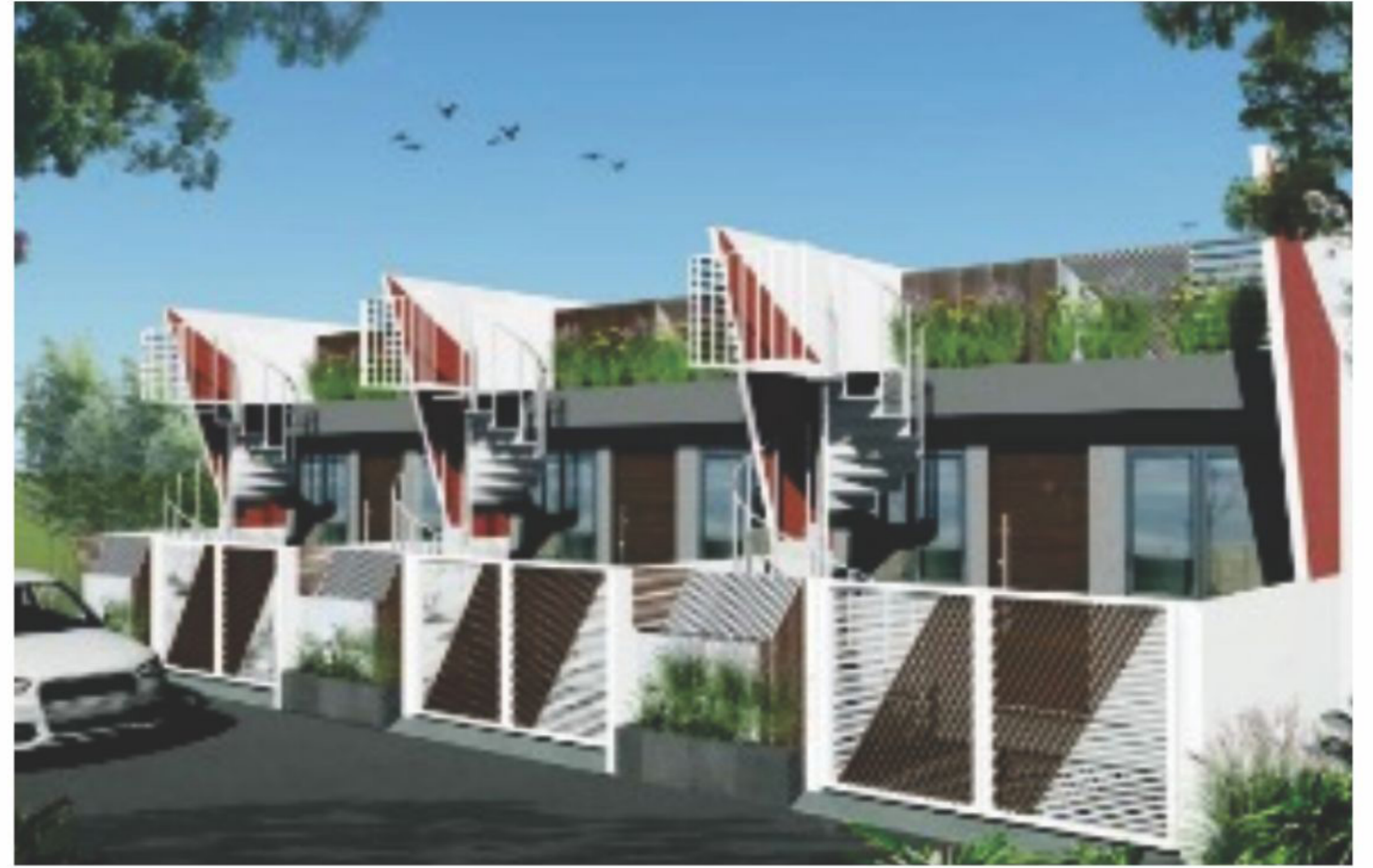
Plot Area : 15'x40' (600 sq.ft.) Ground B/UP : (400 sq.ft.)